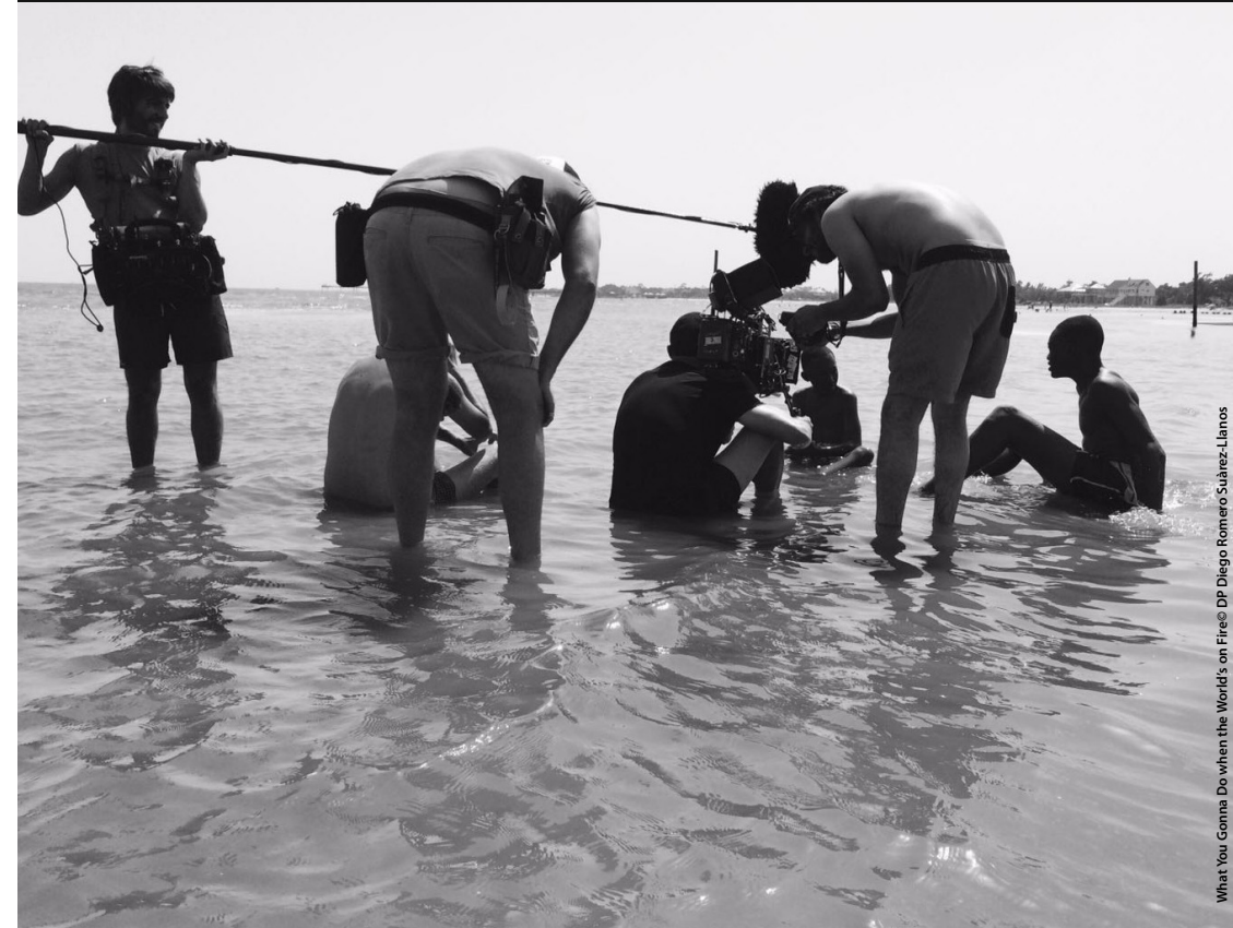
What You Gonna Do when the World's on Fire